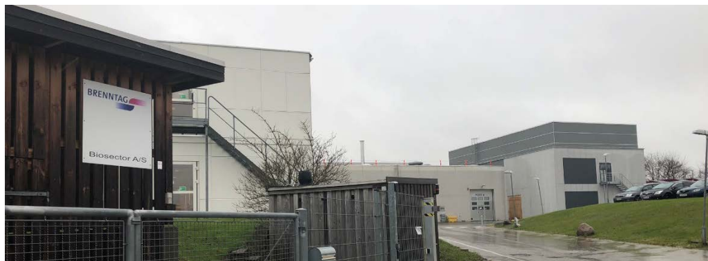
PRO | GRUPPEN har for Brenntag Nordic, udført renrum og UDF i teknikeentreprise.

Udførelsen af renrum og UDF'er opstartes i uge 29 og afsluttes uge 32 med efterfølgende validering sporgasmålinger samt indregulering i uge 33, for opstart af fabrik i uge 34.